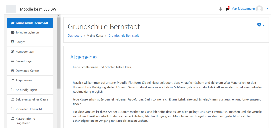
Abbildung 3: Aktuelle Kursansicht